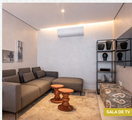
SALA DE TV

(31) 3280-8000 – Neo: Rua dos Timbiras, 100 – Funcionários.