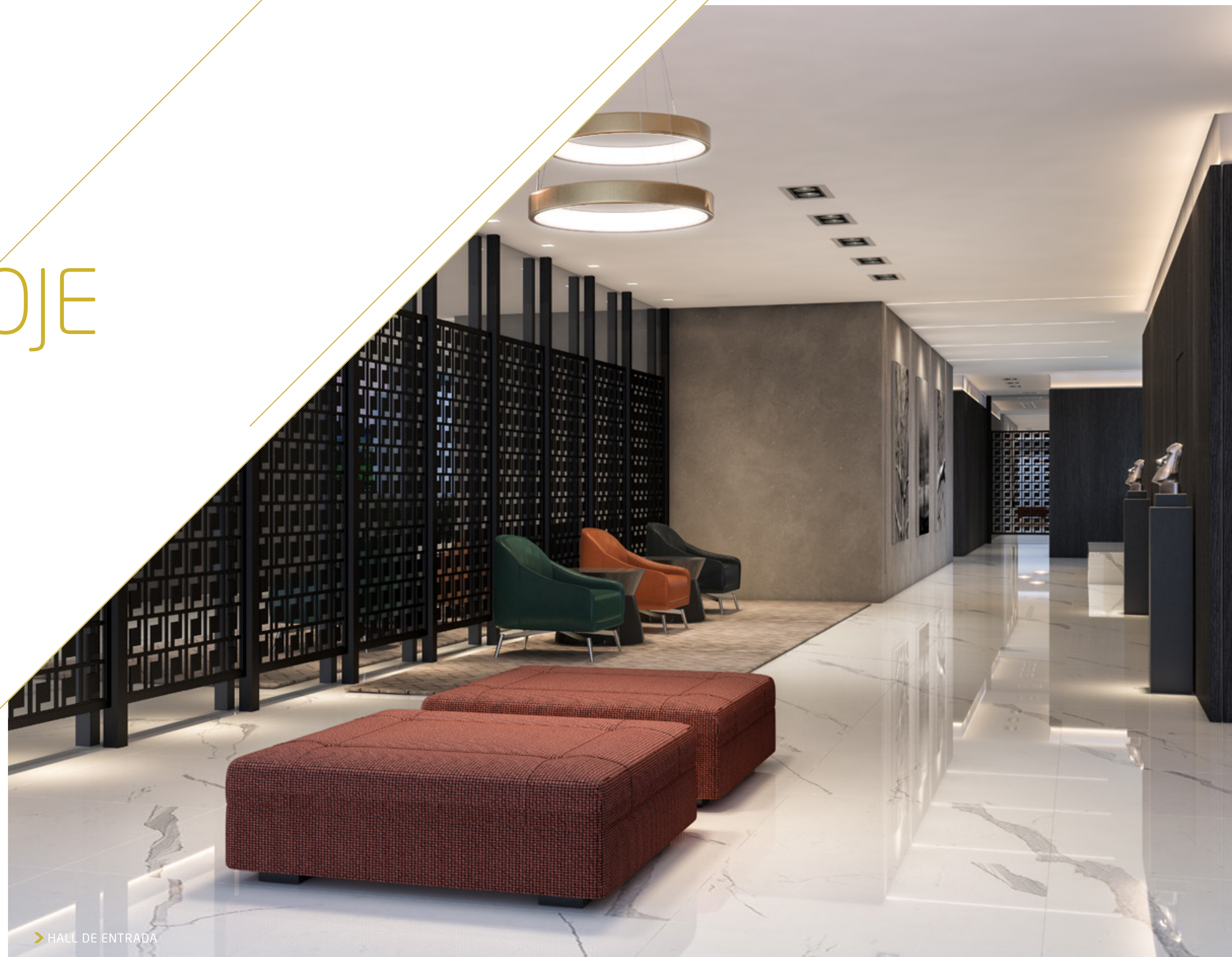
> HALL DE ENTRADA

Tudo isso para deixar evidente, desde o primeiro contato, que o NEO se preocupa com a certeza de não existir lugar como o nosso lar. Viver o novo é isso: sentir-se presenteado, a cada momento, mesmo dentro da sua rotina diária.